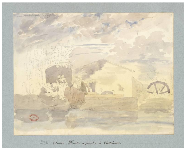
Moulin à poudre de Castelnau près de Montpellier