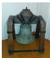
Cloche de la poudrerie de Saint-Jean d'Angély

La première moitié du 19 e siècle voit la fermeture, après de graves explosions, des poudreries d'Essonnes (1820 - remplacée par Le Bouchet), Saint-Jean d'Angély (1818 - transférée à Angoulême), ainsi que celles de Rouen-Maromme (1803) et Colmar (1822), non remplacées.