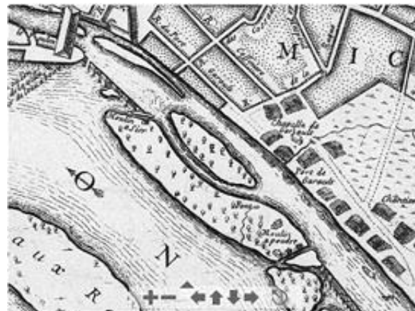
Moulin à poudre de Toulouse : Ile de Banlève. Plan de Toulouse de Jouvin de Rochefort (1774)

Celle de Toulouse, après un premier déplacement de l'île de Tounis à celle de Banlève en 1675, a été transférée dans l'île d'Empalot en 1850 suite à plusieurs accidents graves.