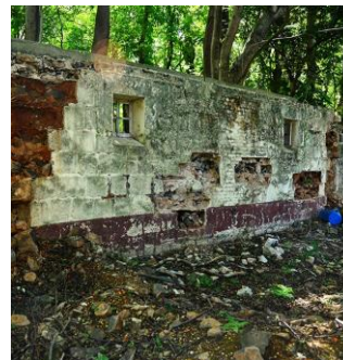
Vestige de moulin à poudre Ile Maurice

Au même moment, il est probable qu'il y en avait aussi au moins un - non localisé - au Québec.