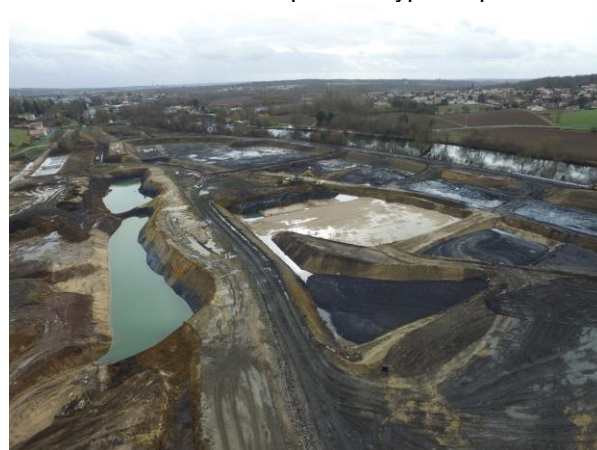
Chantier de dépollution du lac Vallez

Par ailleurs, un groupe de travail, auquel participent des adhérents de l'AF3P, s'est constitué pour rassembler le maximum d'éléments (images, plans, documents de travail, descriptif des machines et procédés utilisés...) relatifs au chantier de décontamination du site de la Poudrerie, d'une part pour conserver la mémoire de ce chantier exceptionnel de près d'une vingtaine d'années, d'autre part pour élaborer un document de référence pour ce type d'opérations.