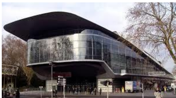
Centre des Congrès Vinci

Le prochain Congrès International de Pyrotechnie "Europyro", dont le GTPS a confié à l'AF3P l'organisation matérielle, aura lieu au Centre international des congrès "Vinci" à Tours du mardi 4 au vendredi 7 juin 2019.