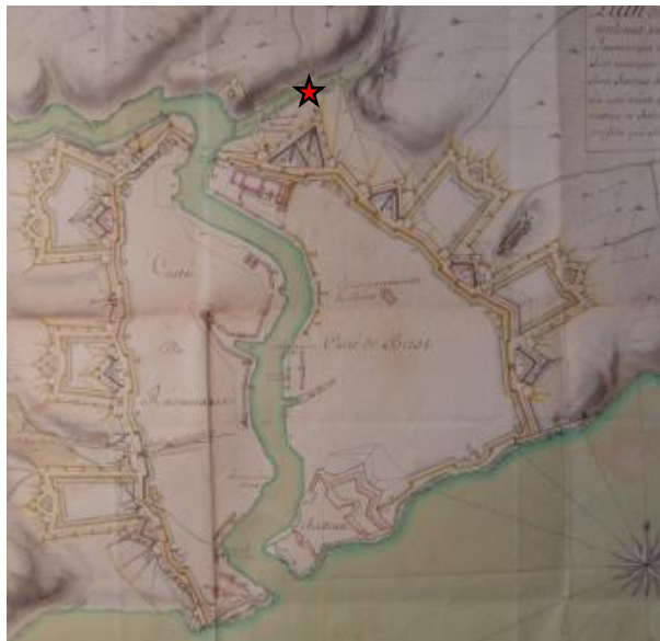
★ Emplacement du moulin à poudre de Brest Plan-projet de 1698

Divers éléments, tels que lieux-dits, documents écrits, tableaux ou gravures, complétés dans certains cas par des restes de constructions, permettent de connaître l'emplacement de nombre de ces anciennes installations.