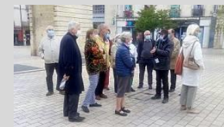
Visites de Titanobel et de Dijon - Septembre 2021

La section Amicale organise pour les adhérents de l'AF3P de nombreuses activités destinées à renforcer les liens entre des adhérents d'âge et d'expérience très divers : voyages, visites, dîners-débats, ... sur des thèmes historiques, économiques ou culturels très variés, cocktails, dîners à l'occasion de l'AG annuelle, de la Sainte Barbe ou autres activités de l'Association. Quelque-soit leur forme, ces rencontres sont toujours très appréciées de tous les participants pour leur intérêt et leur atmosphère conviviale et décontractée.