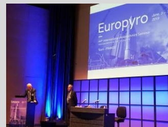
12 e Europyro / 44 ème IPS Tours 2019

La section Evènements organise régulièrement, congrès internationaux, séminaires, colloques, conférences ... destinés à faire connaître les techniques, les utilisations et l'histoire des produits explosifs.