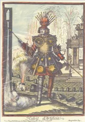
Costume d'artificier - 1695

Elle a besoin du soutien de ses adhérents, des membres correspondants qui sont aussi nos partenaires, et des professionnels du secteur, pour conforter sa situation, élargir son audience et assurer le renouvellement des bénévoles qui l'animent. Ces conditions sont indispensables au développement et au maintien à terme de ses activités en faveur de l'ensemble du secteur de la pyrotechnie.