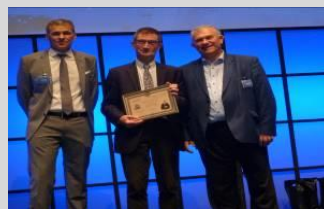
Remise du Prix Paul Vieille 2019

A l'occasion de ces évènements, l'AF3P décerne régulièrement des prix récompensant les travaux les plus pertinents dans ses domaines d'activité.