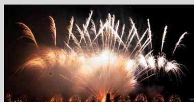
Feu d'artifice - 15 e ISF à Bordeaux

L'AF3P (pour l'apport financier et logistique) en partenariat avec le GTPS (pour l'aspect scientifique) est en mesure d'organiser ce type de manifestations pour tout demandeur du domaine de la pyrotechnie ou d'un domaine connexe.