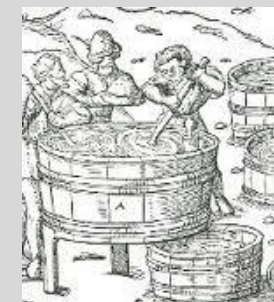
Lavage du salpêtre

section Histoire & Patrimoine : recueil d'objets et documents relatifs aux activités passées, études historiques, soutien aux associations locales de mise en valeur des vestiges industriels,