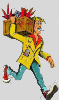
"Le pyrotechnicien fou" Emblème de la Commission "Sécurité" du GTPS

- la diffusion des connaissances dans le domaine de la pyrotechnie, et notamment des travaux des commissions du GTPS, des produits explosifs et de leur industrie vers les personnes impliquées dans ces activités, les utilisateurs et le public,