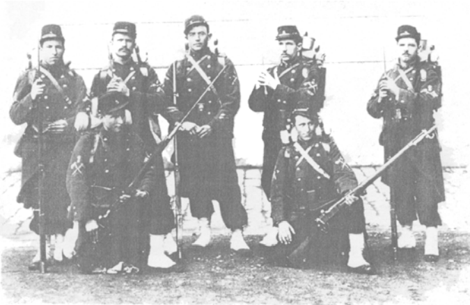
Ces soldats français, photographiés en 1914, sont armés du fusil Lebel